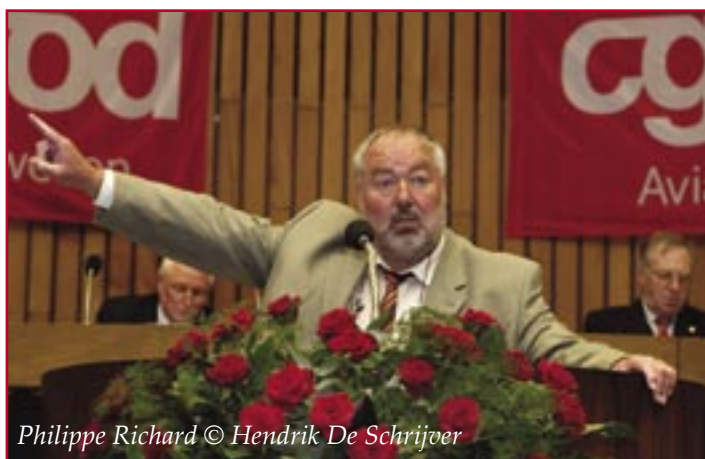
Philippe Richard

Meer dan 400 strijdbare militanten hebben op 7 en 8 mei deelgenomen aan het buitengewoon congres van ACOD Telecom Vliegwezen. Ze hebben nieuwe bakens uitgezet en krijtlijnen getrokken om de toekomst van het personeel van Belgacom, Belgocontrol, BICS, het BIPT en Brussels Airport Company veilig te stellen.