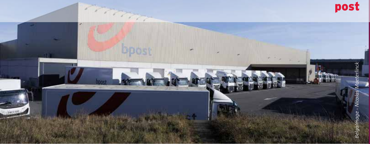
BelgaImage - Nicolas Maeterlinck