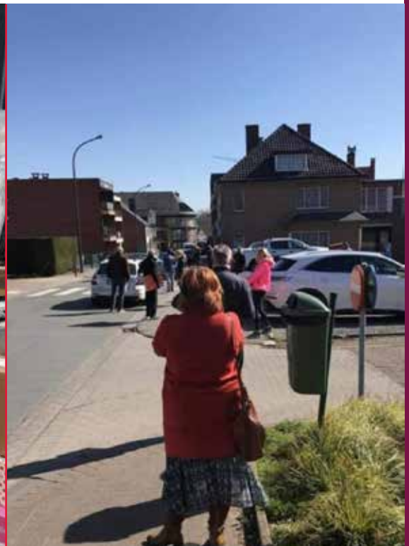
Een foto zegt meer dan 1000 woorden over de koopdrang van de bevolking in coronatijden, zowel bij Mail als bij Retail.