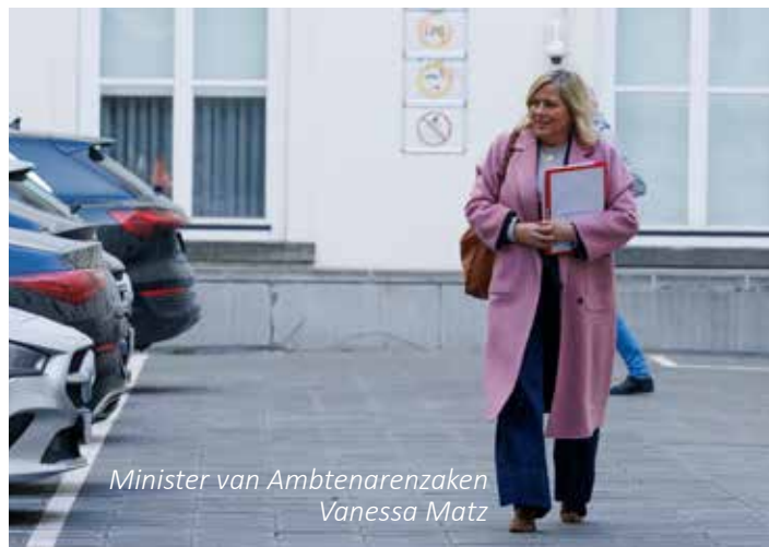
Minister van Ambtenarenzaken Vanessa Matz